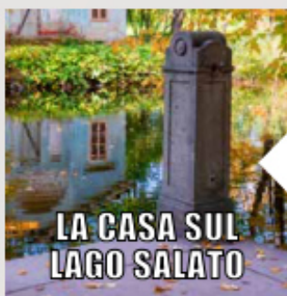
LA CASA SUL LAGO SALATO