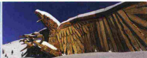
La maestosa aquila, accanto al rifugio Baita Cuz.