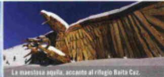
La maestosa aquila, accanto al rifugio Baita Cuz.