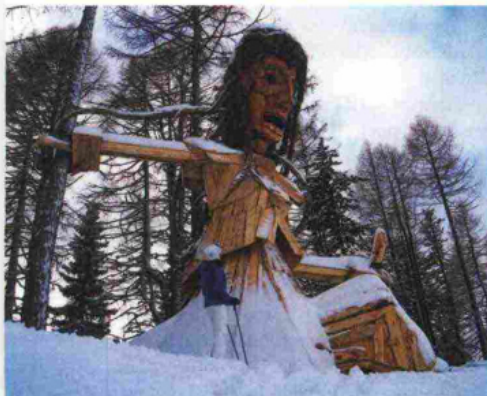
Sopra, la Bregostana, mitica figura delle leggende ladine simile a una strega, realizzata con legno di recupero dall'artista Franz Avancini sulle piste della ski area del Buffaure.

Un branco di cinque lupi, alti due metri e lunghi sei. Una maestosa aquila con un'apertura alare di 12 metri, in tavole di larice intagliate. E ancora, una strega gigante e maxi panchine panoramiche con ali di farfalla e di libellula. Siamo nella ski area della Val di Fassa, in Trentino, dove l'artista trentino Franz Avancini ha realizzato spettacolari opere di land art, tra le cime dolomitiche, sulle piste da sci degli impianti del Buffaure. www.buffaure.it