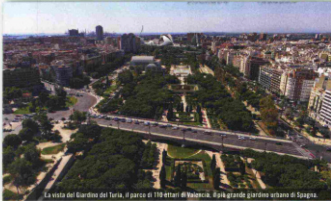
La vista del Giardino del Turia, il parco di 110 ettari di Valencia. Il più grande giardino urbano di Spagna.