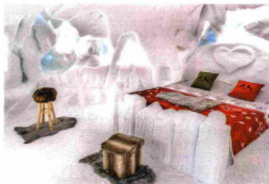
DALL'ALTO: L'ESTERNO DELL'HOTEL PLUNHOF IN VAL RIDANNA; UN PANORAMA DELLA VAL SENALES IN ALTO ADIGE; UNA DELLE SUITE IGLOO IN TRENTINO, SUL GHIACCIAIO PRESENA.