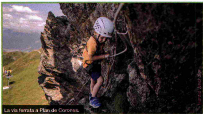
La via ferrata a Plan de Coronas.

Ma ovviamente il Buffaure si può vivere anche in completa autonomia, percorrendo i sentieri tematici, o curiosando tra le tante installazioni come il branco di 5 lupi che risalgono il crinale, l'aquila accovacciata o le panche artistiche a forma di drago o con ali di farfalla e di libellula.