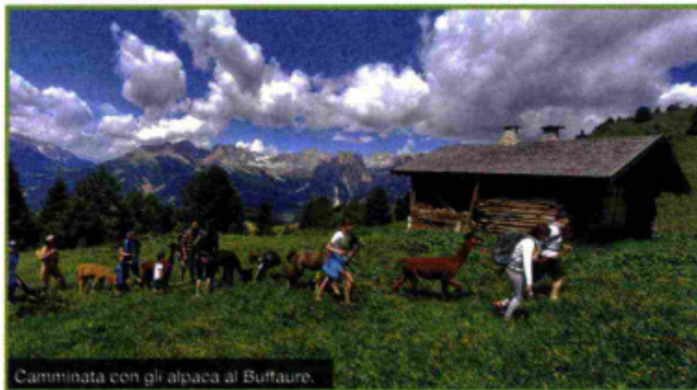
Camminata con gli alpaca al Buffaure.