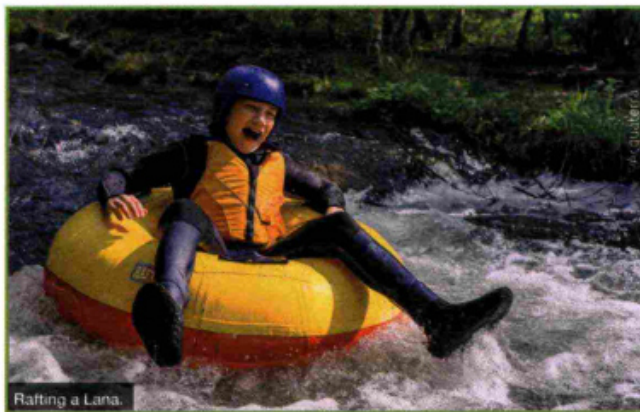
Rafting a Lana.

Chi invece preferisce attività ad alto tasso di adrenalina, troverà pane per i suoi denti con la pista da tubing estiva da cui scendere con i gommoni gonfiabili, il trampolino Kron , per provare l'ebbrezza di toccare il cielo con un dito, la scalata al pilone alto sei metri e la nuovissima via ferrata per bambini! Equipaggiati con lo speciale kit per via ferrata, i giovani esploratori possono provare l'arrampicata in esterno in maniera divertente e sicura. Dopo aver fatto il pieno di emozioni perché non rilassarsi un po'? Vi aspettano una pista di biglie lunga 40 metri, interamente in legno, e il dolomites.zoo , dove esplorare l'affascinante mondo animale del Parco Naturale Fanes-Sennes-Braies. E per gli appassionati di montagna il Messner Mountain Museum ha una delle sue sedi proprio qui: MMM Corones racconta la storia dell'alpinismo attraverso una serie di reperti e testimonianze che affascineranno grandi e piccini. Estate a misura di bambino anche a Lana , con un ricco programma di appuntamenti settimanali rivolti a diverse fasce di età: ogni giorno una proposta diversa, ma con un comune denominatore, rendere l'estate piena di esperienze interessanti e divertenti. Tra le più originali La vita nel pollaio , in cui la contadina del maso Tannerhof mette a disposizione il proprio pollaio mobile per soddisfare le curiosità dei bambini. Se siete in cerca di avventure e